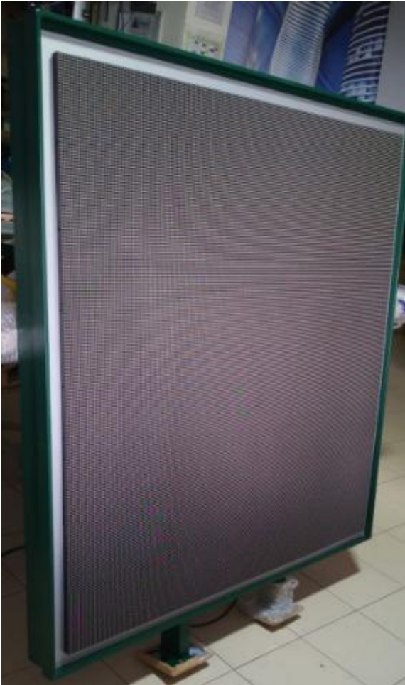
Tabellone outdoor P5 192cmX96cm